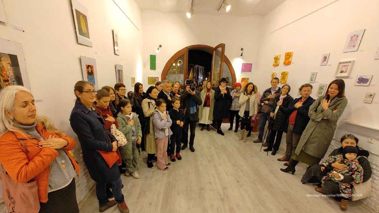
Vernisajul expoziției NIMENI SINGUR